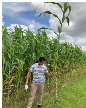
新燃料ニューソルガム