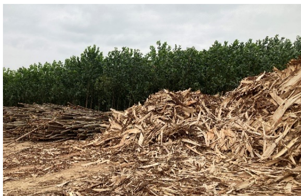
トゥエンクワン省にて収集した木質残渣