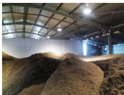
マレーシア/PKS貯蔵庫